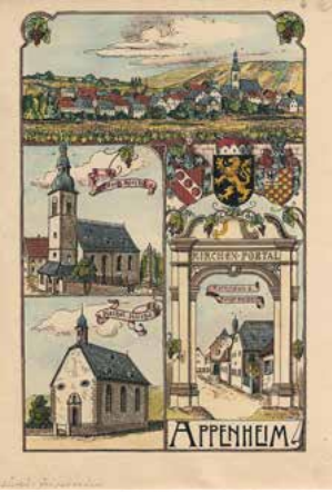
Appenheim. - Mehransichtenblatt. - "Appenheim". Historische Ortsansicht. Kolorierter Holzstich, um 1910. 18,0 x 11,6 cm (Darstellung) / 20,3 x 13,6 cm (Blatt). Dekoratives Blatt, das mehrere Ansichten von Appenheim zeigt. Oben ist eine Gesamtansicht des Ortes zu sehen, darunter auf der linken Seite die Evangelische und die Katholische Pfarrkirche. Auf der rechten Seite ist oben das Wappen des Ortes zu sehen und darunter das Rathaus. Blatt auf einem Trägerpapier kaschirt und an den Rändern beschnitten. Etwas gebräunt. Insgesamt in einem guten Erhaltungszustand.